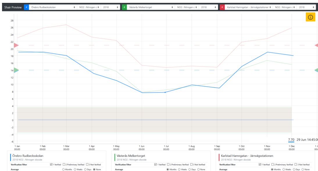
Figur 1 Bild framtagen av Referenslaboratoriet för tätortsluft vid Stockholms universitet, december 2019.

Då det finns en osäkerhet i och med den indikativa mätmetoden och då insuget på mätinstrument bör bytas till ett ”amerikanskt insug” (rekommendation från referenslaboratoriet på Stockholms universitet) för att säkerställa en god mätning, så bör kommunen verifiera mätningarna av kvävedioxid framöver.