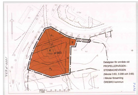
Gällande detaljplan 1880-P232

Koordinatsystem: Sweref 99 15 00 Höjdsystem: Rh 2000 Skala 1:1000 (A4)