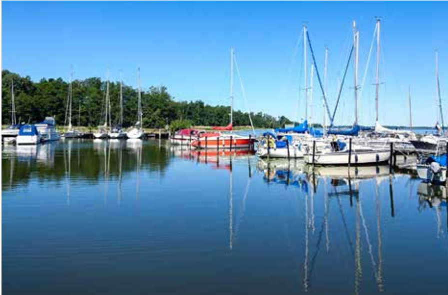
Det låga vattenståndet i Hjälmarens har gjort det svårt att ta sig ut med båtarna även i Hampetorp.