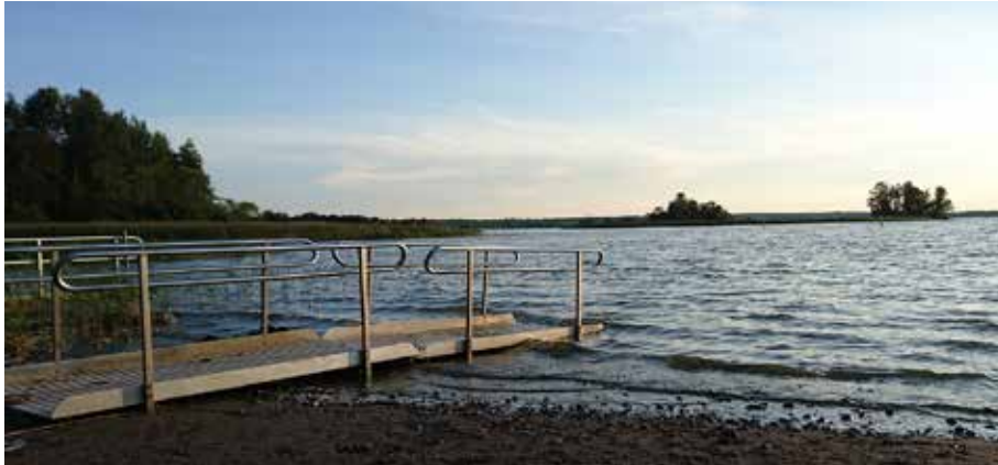
Rullstolsrampen kom ut i augusti.