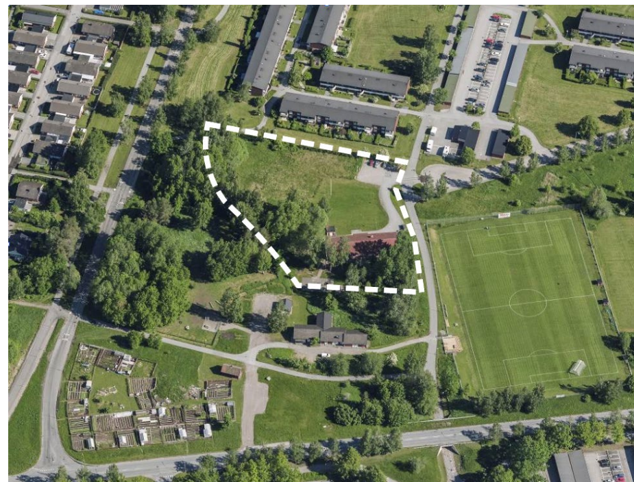
Bild på planområde

Inom planområdet finns på den södra fastigheten en mindre förskolebyggnad med tillhörande förskolegård. På den norra fastigheten har det tidigare också funnits en förskola men den revs i början av 2010-talet. Tomten är idag obebyggd. Längs med planområdets västra och södra kant finns gott om uppväxta träd. I övrigt består området av gräsytor, lekplats och en hårdgjord yta avsedd för parkering.