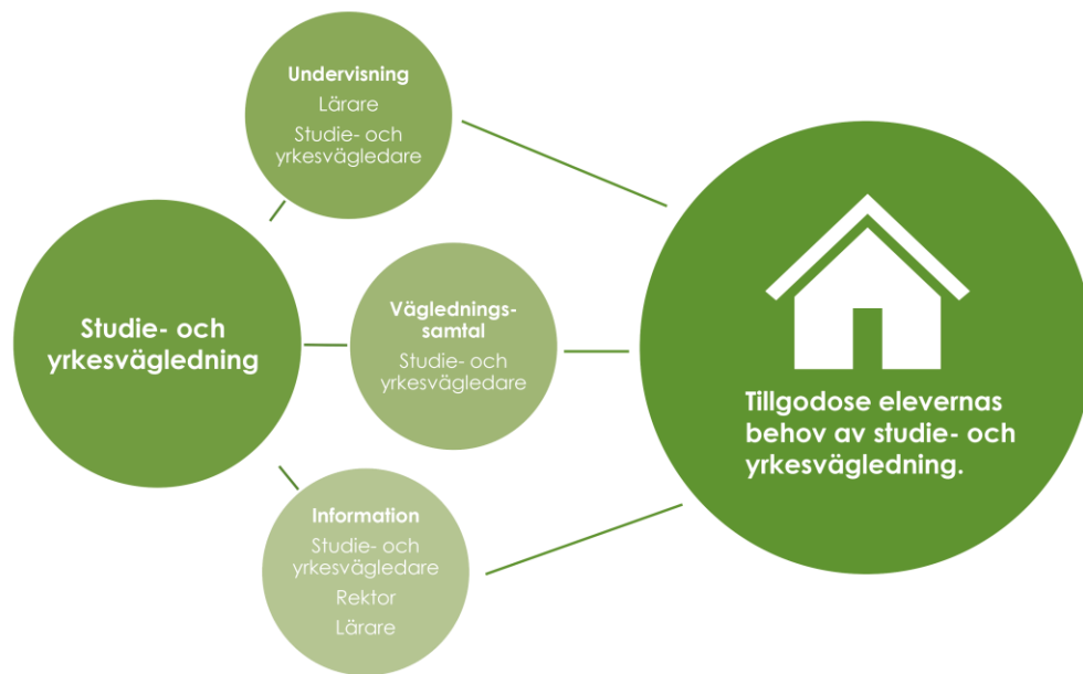
Figur 1. Arbete med studie och yrkesvägledning. 3