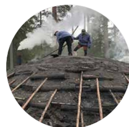
Kolmilan i Lockhyttan.