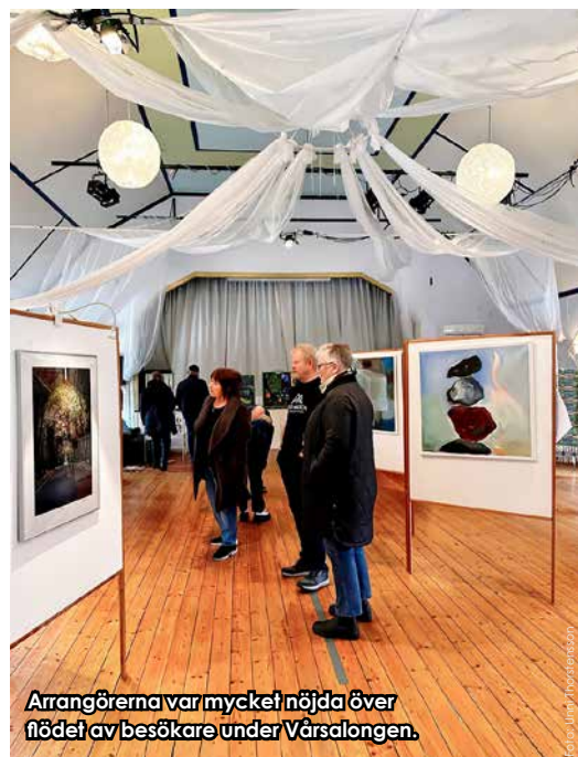
Arrangörerna var mycket nöjda över flödet av besökare under Vårsalongen.