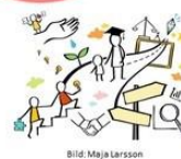
Huvudmännens ansvar och åtagande enligt nationella handlingsplanen för digitalisering av skolväsendet