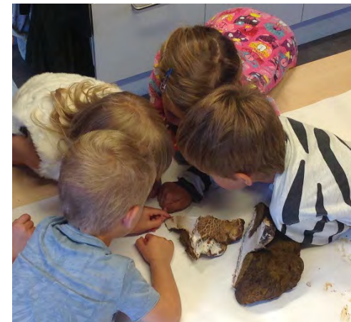
I ett undersökande tillsammans