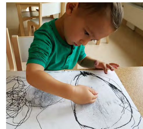
Min tanke tar form på pappret