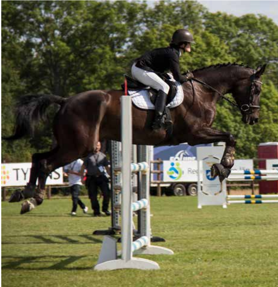
Banhoppning var ett av tre moment vid SM i fälttävlan.