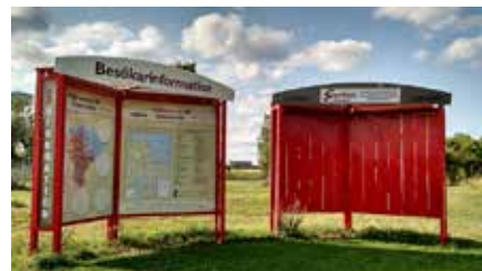
Samverkarna Samverkarna ska göra färdigt informationstavlorna under hösten.