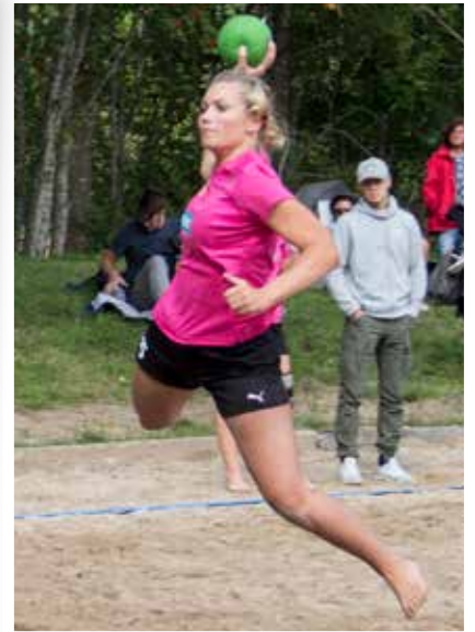
Kvartsfinalen i damsenior mellan Willes Sugarbabes och Girl power slutade med 14-14.