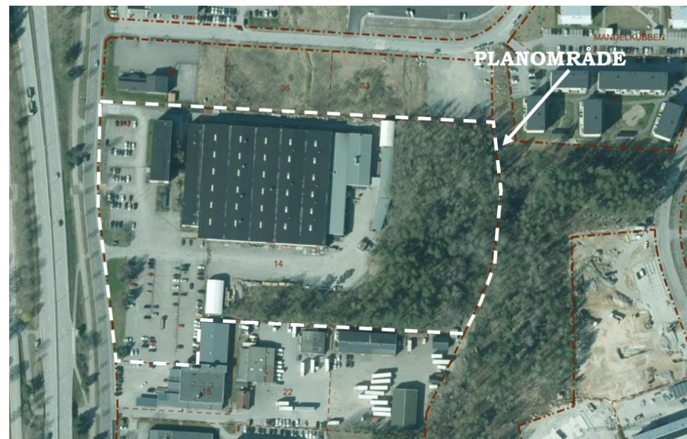
Bild på planområde

Planområdet består idag av verkstadsindustri, det är beläget i Bettorps industriområde som ligger i norra delen av Örebro, cirka 3.5 km från Örebro centrum. Planområdet omfattar fastigheten Karossen 14 som ägs av ett privat företag, EMBA AB, hela fastigheten är i gällande detaljplan reglerad till markanvändningen industri . Planområdet består främst av hårdgjorda asfalterade och bebyggda ytor. Den östra delen av planområdet är oexploaterad och utgörs av ett skogsparti.