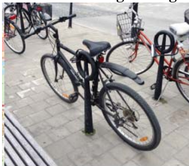
Pollare Våghustorget (Nola Hoop)

44 procent tycker att detta ställ är mycket bra eller bra.