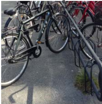
Snedställda hjulhållare (Nola Örebro)

45 procent tycker att detta ställ är mycket bra eller bra.