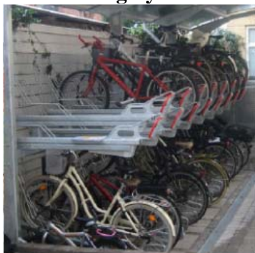
Tvåvånings cykelställ (Veksö Easylift)

53 procent tycker att detta ställ är mycket bra eller bra.