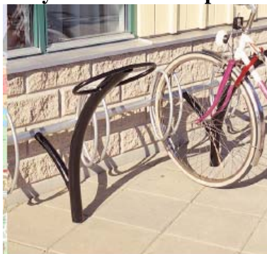
Cykelställ med ellips (Hags Ellipse)

69 procent tycker att detta ställ är mycket bra eller bra.