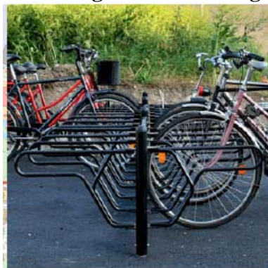
Låsning av ram mot båge (Cyklos Delta)

83 procent tycker att detta ställ är mycket bra eller bra.