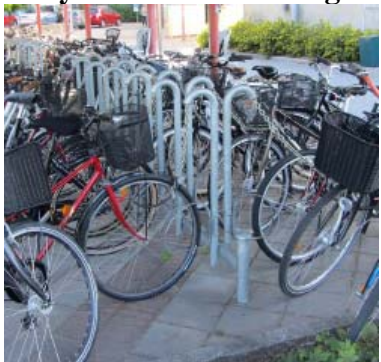
Cykelställ med utdragbar dragkedja (Tejbrant Plug Base)

53 procent tycker att detta ställ är mycket bra eller bra.