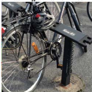
Låsning av ramen med kedja (Cyklos Alfa)

75 procent tycker att detta ställ är mycket bra eller bra.