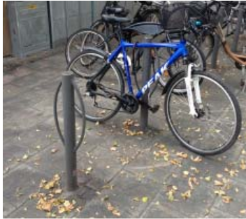
Pollare Järntorget (Vestre Urban)

54 procent tycker att detta ställ är mycket bra eller bra.