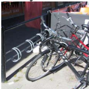
Små hjulhållare (Hags Orion)

39 procent tycker att detta ställ är mycket bra eller bra.