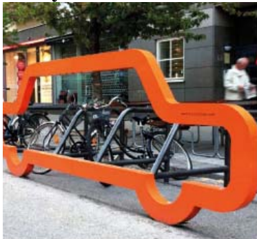
Cykelställ i form av bil (Smekab Car Bike Port)

71 procent tycker att detta ställ är mycket bra eller bra.