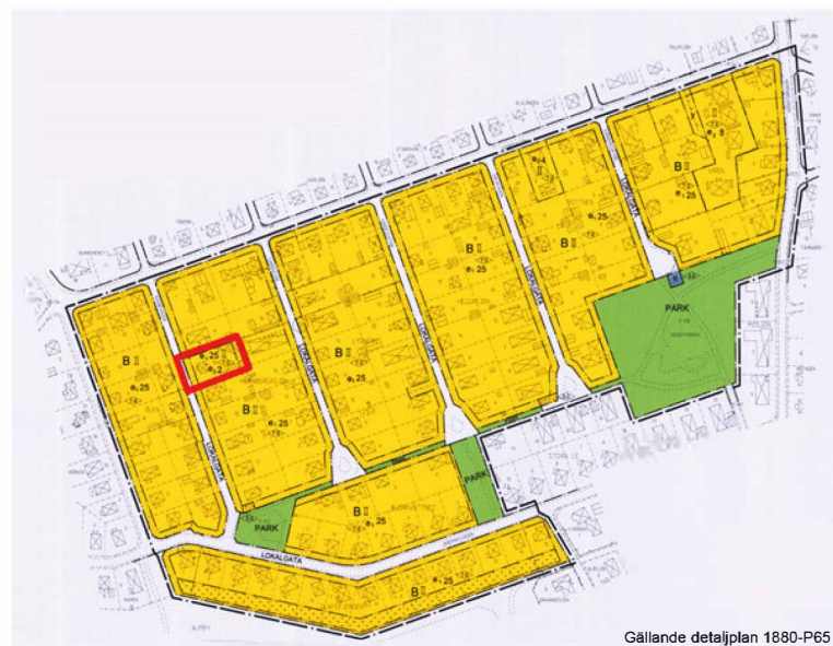
Gällande detaljplan 1880-P65