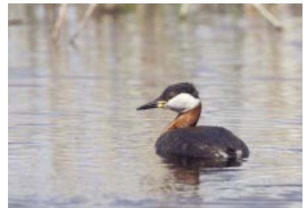
Gråhakedopping. Red-necked grebe. Rothalstaucher.