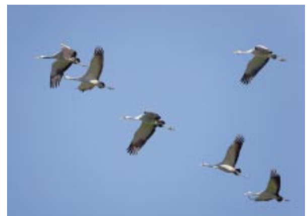
Tranor. Common crane. Kraniche.