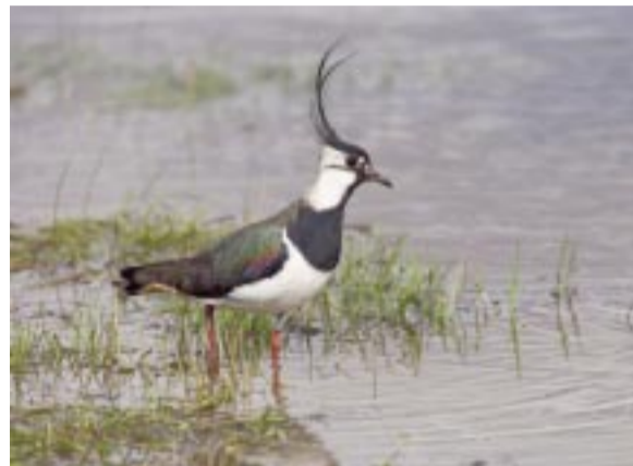
Tofsvipa. Lapwing. Kiebitz.