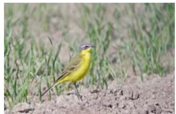
Gulärta. Yellow wagtail. Nordische Schafstelze.