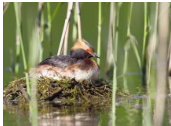
Svarthakedopping. Horned grebe. Ohrentaucher.