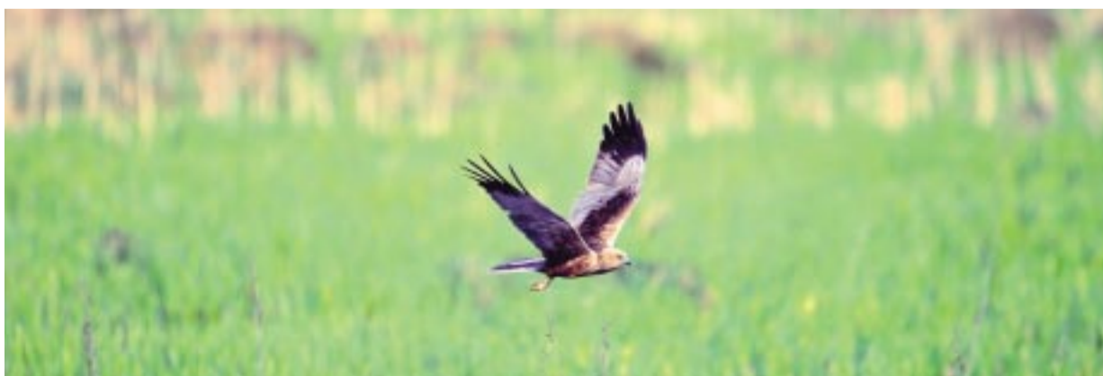
Brun kärhök. Marsh harrier. Rohrweihe.