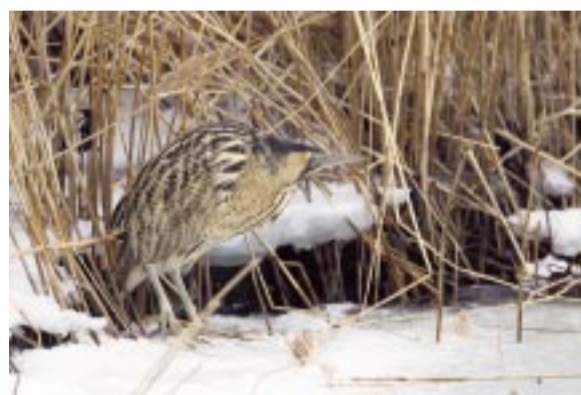
Rördrom. Eurasian bittern. Große Rohrdommel.