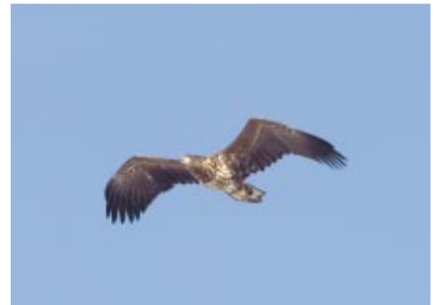
Havsörn. White tailed eagle. Seeadler.