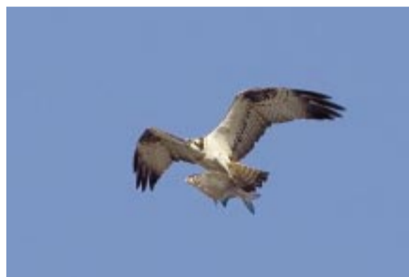
Fiskgjuse. Osprey. Fischadler.