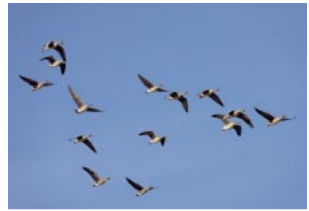
Sädgäss. Bean goose. Saatgänse.