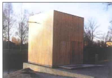
Den interaktiva konstpaviljongen "Lux"

Konstnär och projektansvarig: Stefan Rydén