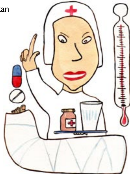
PENGAR ERSÄTTER INTE EN BRUTEN FOT.