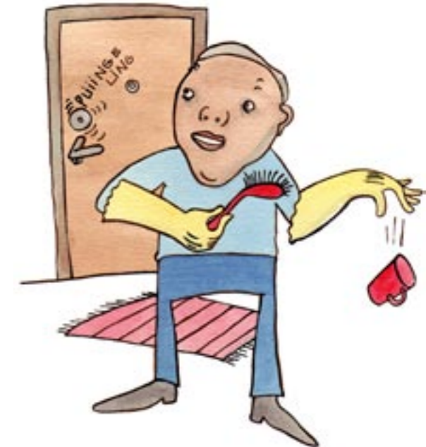
GE DIG TILL KÄNNA, VISA ATT DU ÄR HEMMA.