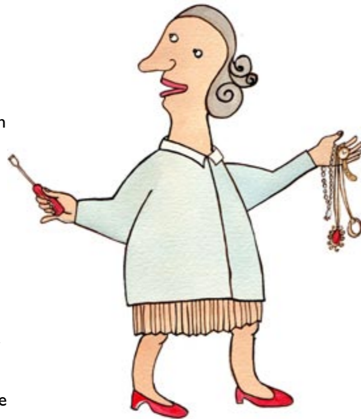
GÖM SMYCKEN OCH PENGAR PÅ UDDA STÄLLEN.