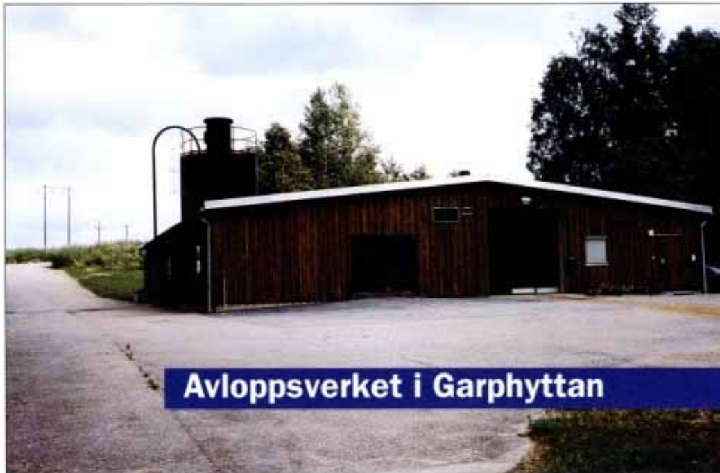
Avloppsverket i Garphyttan