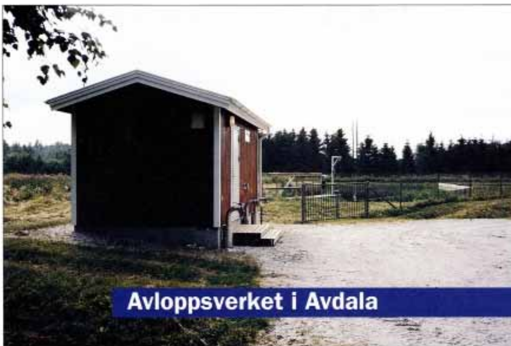
Avloppsverket i Avdala