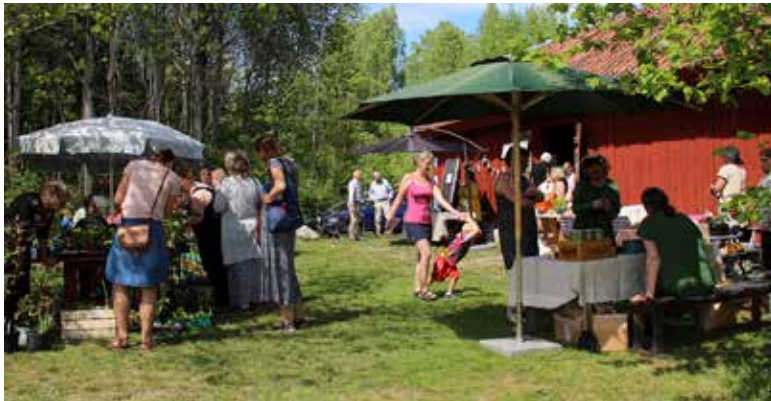
Vid Skölds Torp var det fullt av besökare som ville köpa blommor och fika.