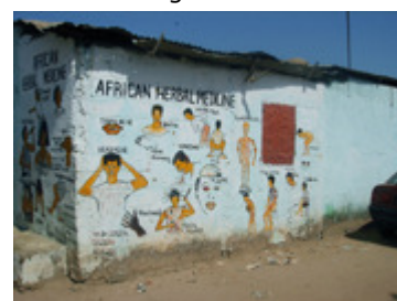
Husvägg i Gambia