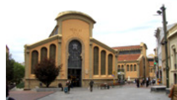
Saluhall i Terassa, Spanien

Lärare och tre elever från barn- & fritidsprogrammet och omvårdnadsprogrammet var i Gijon tre veckor. APU på arbetsplatser i Gijon var en del av programmet.