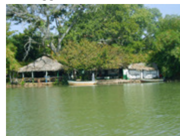
Vy över Gambia