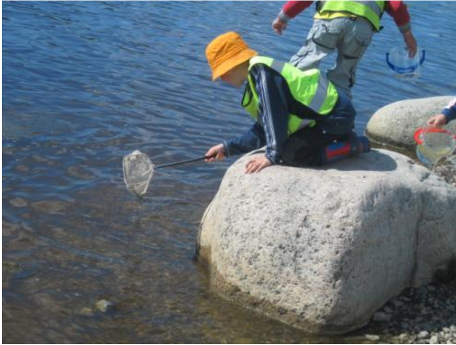
Ser hur djuren trivs vid Oset.