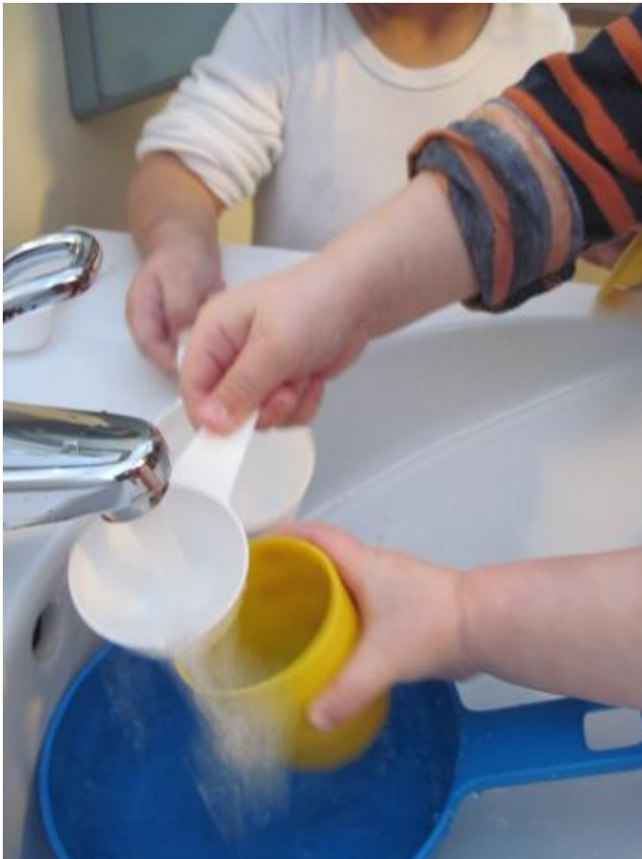
Nu är vattenkranen på en stund, alla vill samla vatten.