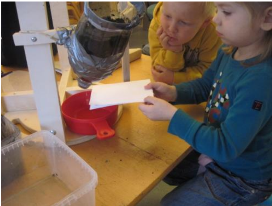
Hur vi själva kan rena vattnet.

4-5 års avd. har följt vattnets betydelse för växter och djur gm. regelbundna besök vid en skogstjärn, Ex. har vi följt paddans utveckling.