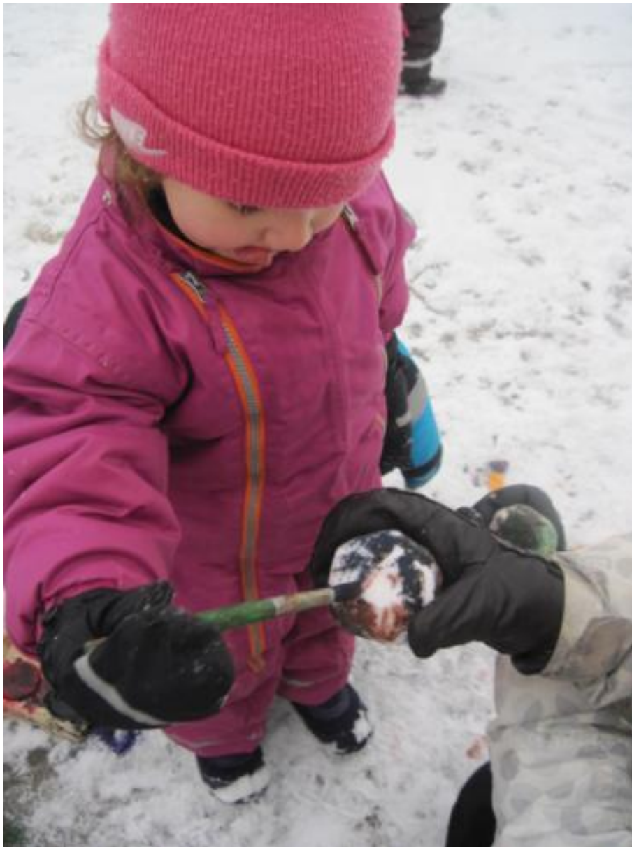
Barnen har provat måla på snöbollar, enligt egen önskan.