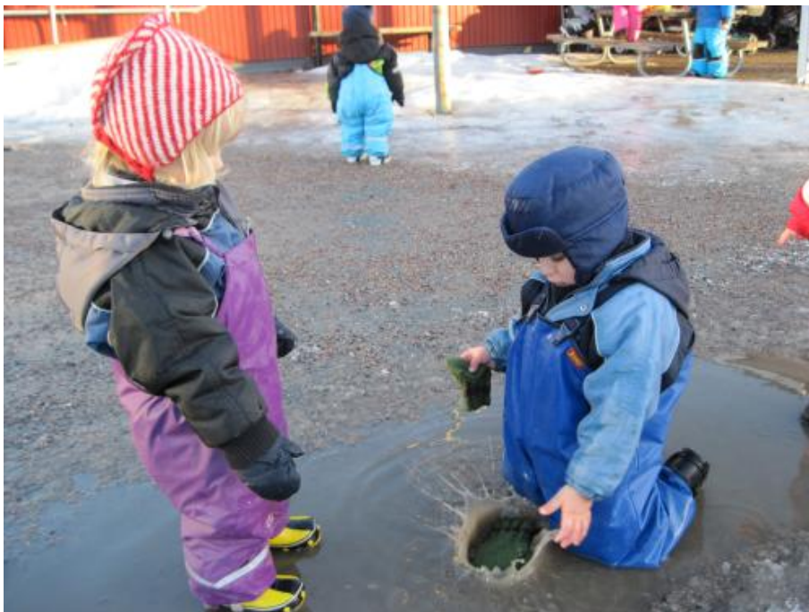
Barnet erfar hur vatten plaskar i smältvattnet

Utifrån en idé och förslag från ett femårigt barn besökte 4-5 års-avd. Örebros vattentorn Svampen. Där experimenterade vi på Aqua nova med tex. slussning och vattentornets funktion.