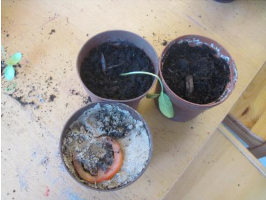
För att växa behöver vi alla vatten. Växter och varelser.