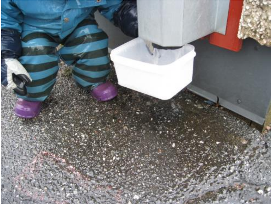
ta vara på regnvattnet för lek och undersökande

Mål 3: Vi ska undersöka vilken betydelse vatten har.