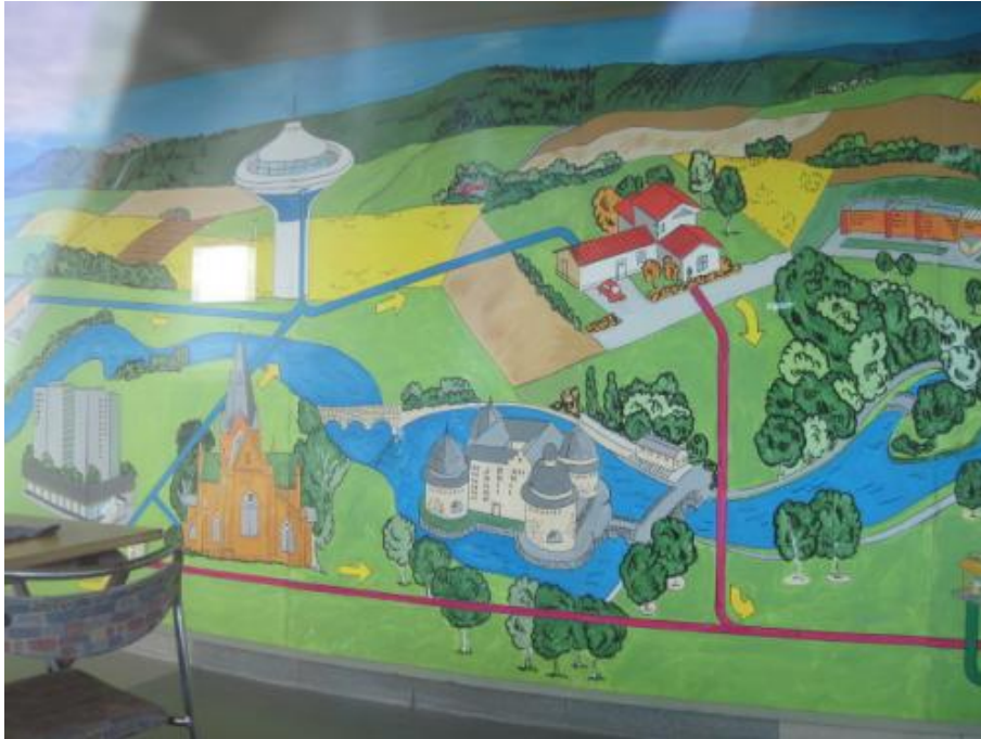
Vart kommer vattnet ifrån.