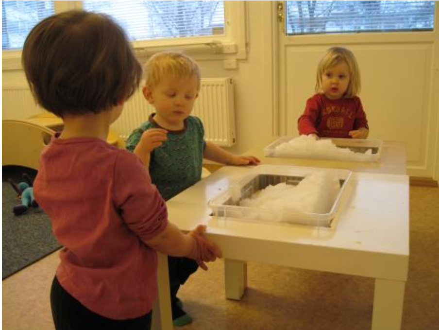
enligt barnets inflytande blev det snö/snö i baljan

Barnen på 4-5 årsavdelningen har också under våren byggt vattenreningsverk med petflaskor, kol, sand, tyg och papper. De har provat att rena vatten från bl. a. en skogstjärn och från vattenkranen. provade även att rena julmust och kaffe efter förslag från barnen.