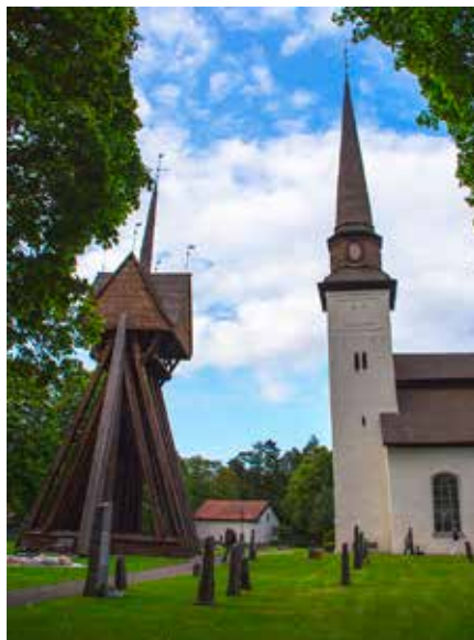
Under sommaren har det varit andakt varje dag i Glanshammars kyrka.

Samtidigt hade Ödeby kyrka öppet med guidade turer under fem helger. Det serverades fika och korv med bröd, vilket 201 personer njöt av.