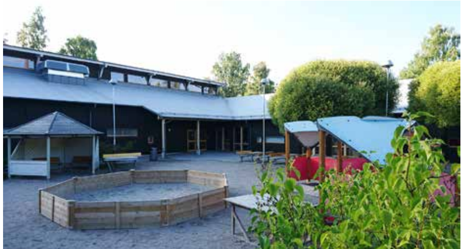
Med hjälp av föräldrar och vaktbolag har skadegörelsen minskat på Glanshammars skola.