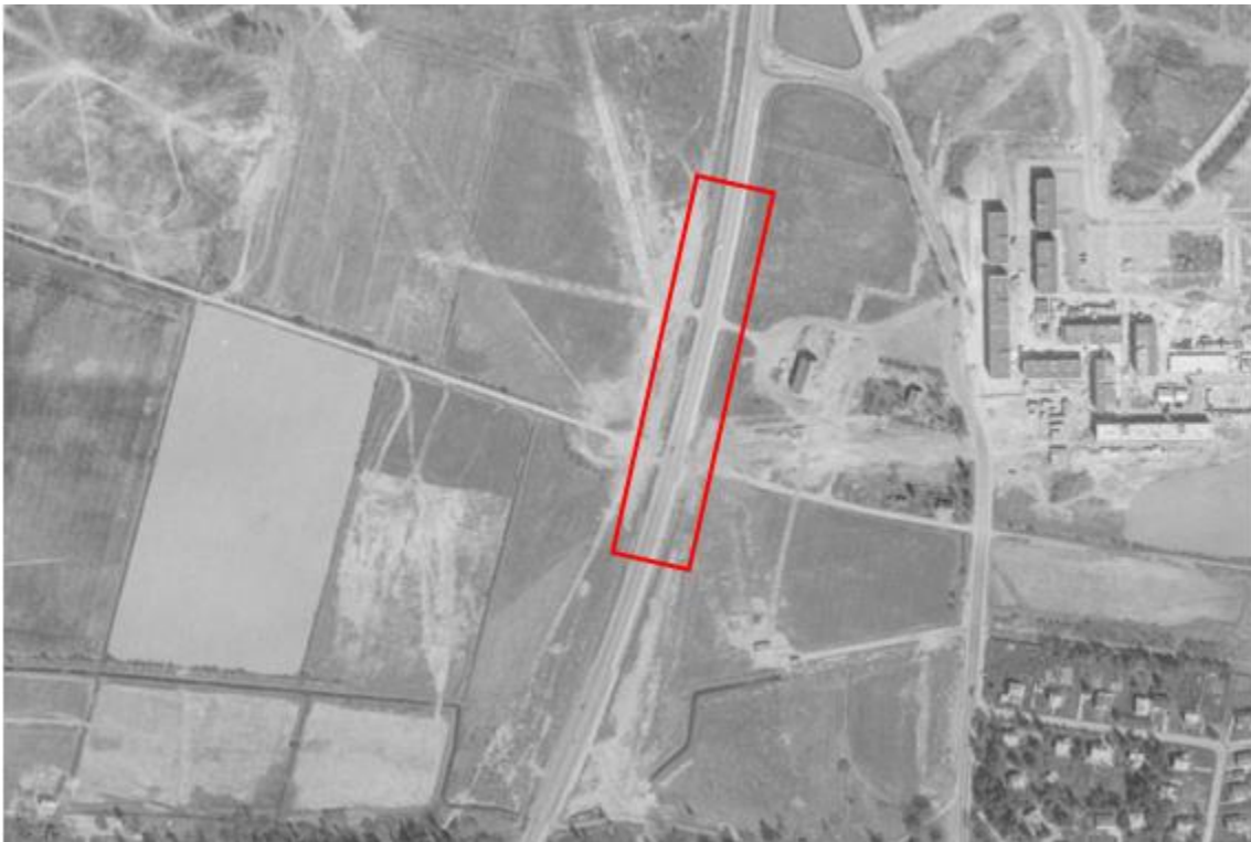
Figur 3.4 Flygfoto daterat 1975, aktuellt undersökningsområde ungefärligt markerat i rött.