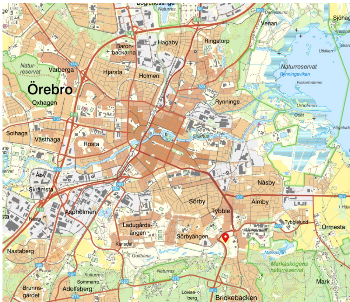
Figur 3.1 Aktuell del av fastigheten Almby 11:199 ungefärligt markerad med en röd markering.

Fastigheten och undersökningsområdet är beläget söder om centrala Örebro. Området beräknas omfatta cirka 11 000 m 2 och dess läge relativt Örebro centrum visas i figur 3.1 och undersökningsområdets ungefärliga utbredning visas i figur 3.2.