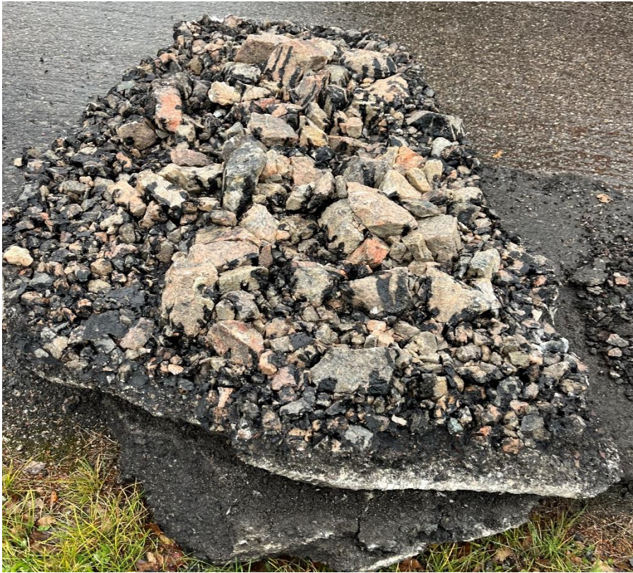
Figur 6.1. Foto från provpunkten SM2. Undersidan av asfalten där bärlager sitter fast i asfalten.