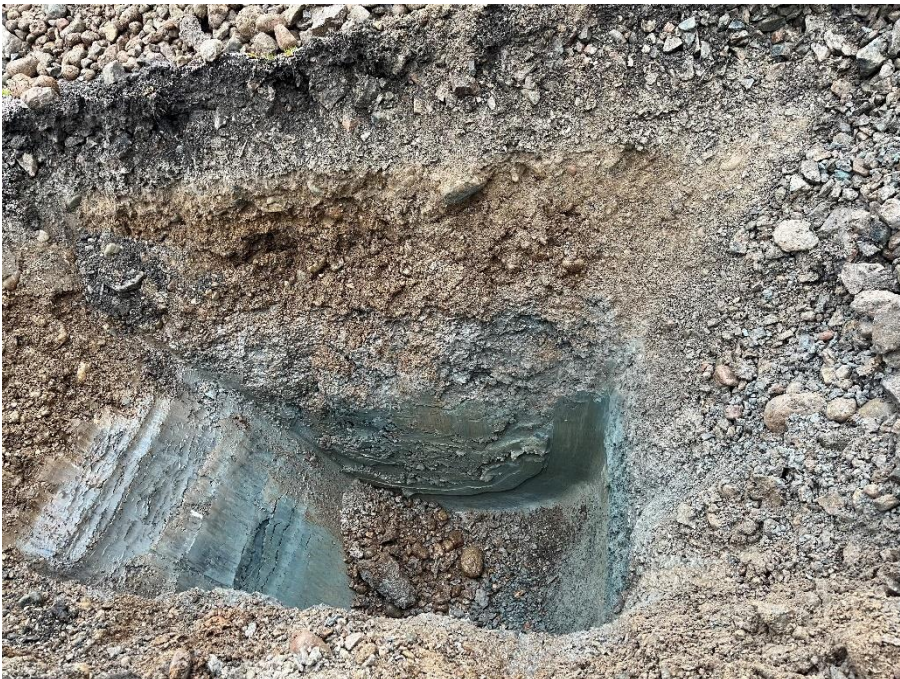
Figur 6.2. Provpunkt SM4 visar den generella jordartsprofilen i undersökningsområdet.