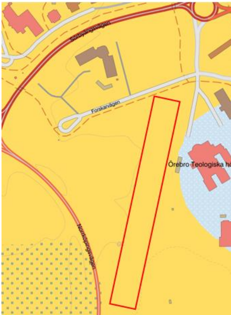
Figur 3.5 Utdrag ur SGU's kartvisare för jordarter där undersökningsområdet är ungefärligt markerat i rött. Gult område står för postglacial lera och ljusblått område med prickar står för sandig morän.

Enligt SGU:s kartvisare utgörs det översta lagret av den naturliga jordarten inom undersökningsområdet av postglacial finlera (SGU, 2023), se figur 3.5. Jorddjupet uppgår till ca 7–13 meter baserat på olika jorddjupsobservation på grannfastigheter (SGU, 2023). Grundvattenförekomsten Närke-slätten (WA68642825) återfinns under utredningsområdet vilket är ett grundvattenmagasin i sedimentär bergförekomst. Den har klassats med god kemisk och kvantitativ status för förvaltningscykel 2017-2021 (VISS, 2023).