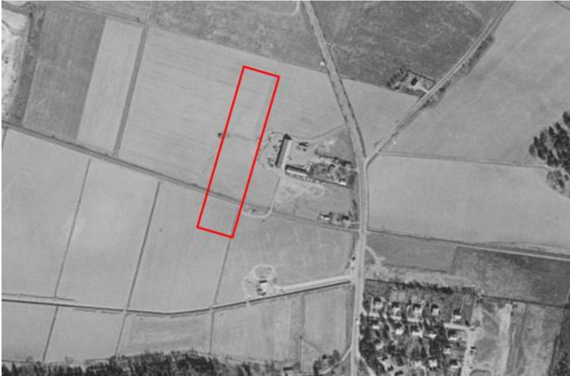
Figur 3.3 Flygfoto daterat 1960, aktuellt undersökningsområde ungefärligt markerat i rött.