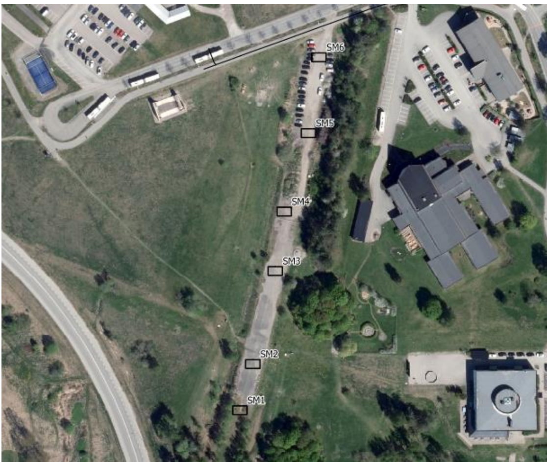
Figur 5.1 Provtagningspunkternas lägen inom undersökningsområdet.

Provtagningspunkternas geografiska lägen redovisas i figur 5.1 och bilaga 1.