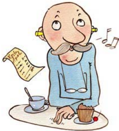
ەرتشاب ىنىبەرەد رتمەك تەكئەراپ ىفىك دنەچرەه