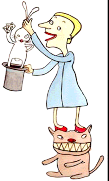
!نەكەب تەمراگەھس ھلىئەھم