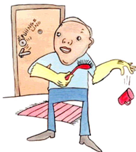
ىلئامەل ەك ەدب نانىنى