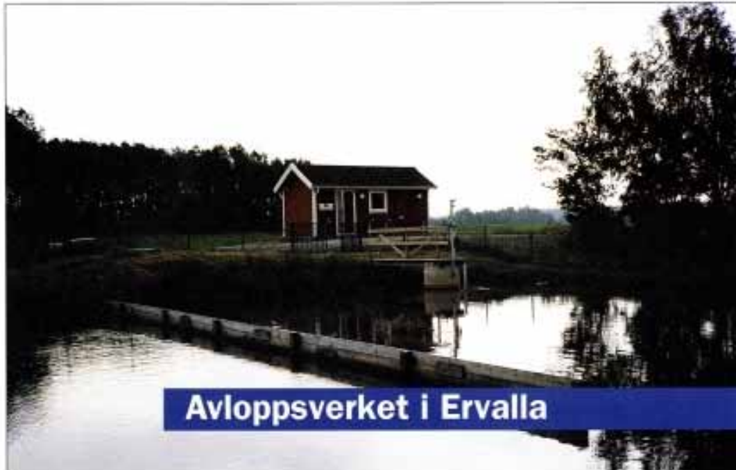
Avloppsverket i Ervalla